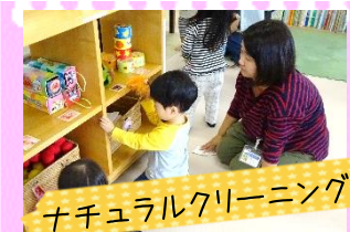
ナチュラルクリーニング

「来月の誕生会、何をやる？」 「次回の製作は何にしようか？」 などの話し合いをします！