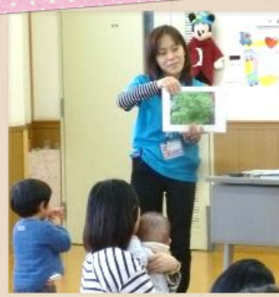
年に数回、専門の方が来てお話してくれます！