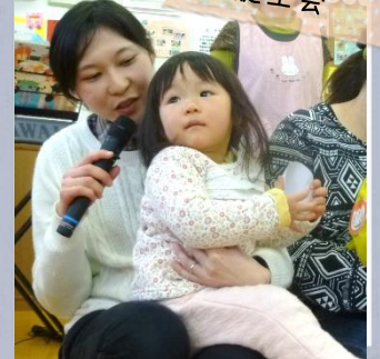
「好きな遊びはなあに？」ママにインタビュー！