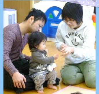
月に一度、季節にちなんだ製作をしています！