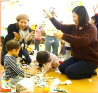
みんなで一緒に楽しいね♪