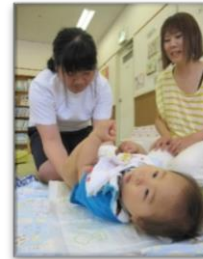
おむつ替えに挑戦！それを優しく見守るお母さん♡