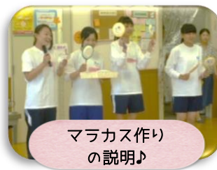
マラカス作りの説明♪