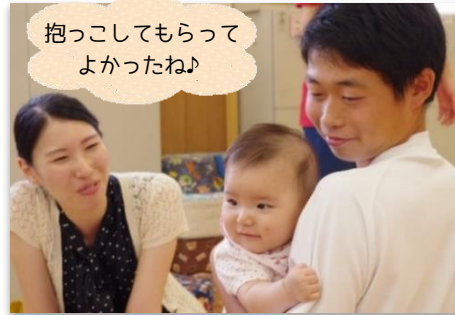
抱っこしてもらってよかったね♪

あかちゃんを抱っこして「かわいい♪」「あかちゃんってやわらかい♡」と高校生やお母さんたちの笑顔があふれるひと時になりました。