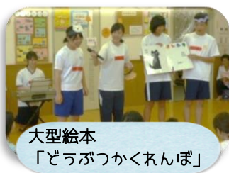
大型絵本「どうぶつかくれんぼ」