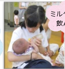
ミルクたくさん飲んでね♡

2日目は、高校生が子育てサロンに登場！前日から練習した出し物を親子の前で披露しました。