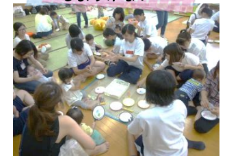
どんなマラカスにしようかな？