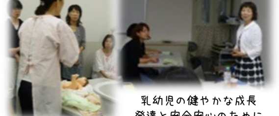
赤ちゃんがいる生活