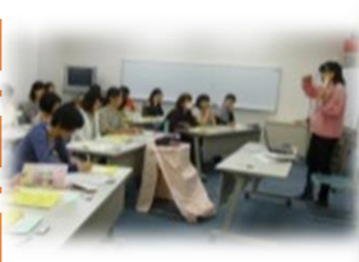
ファミリー・サポート制度について