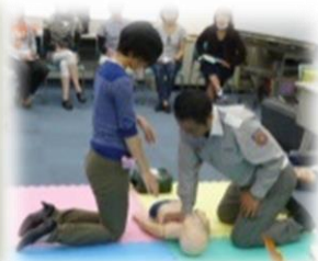
乳幼児の応急手当 救急法