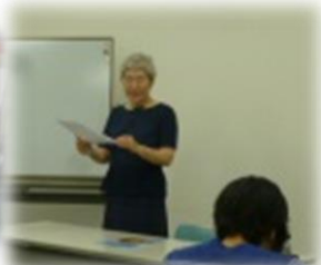
妊娠から出産・育児期における女性の健康