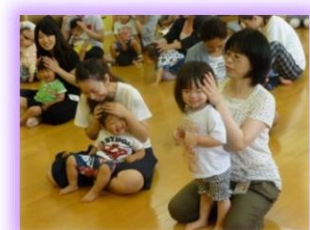
曲に合わせてポディタッチ!