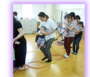
ママと一緒にリズムに 合わせて歩きます!