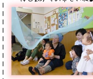
『貴婦人の乗馬』の曲に 合わせてスカートがふわふわ