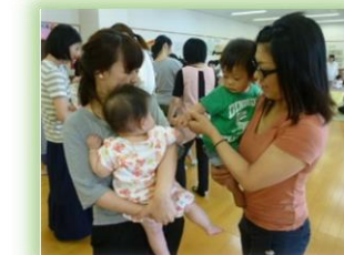
はじめまして! よろしくね♪