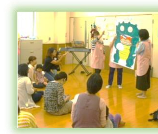
音楽と絵本の読み聞かせ 絵本の世界が広がります