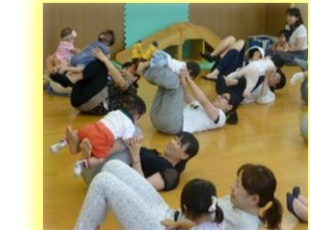
ママの足の上でゆ〜らゆ〜ら!