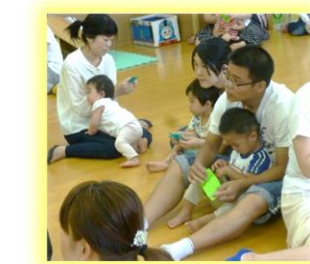
ぱぱと一緒に楽しいな♪