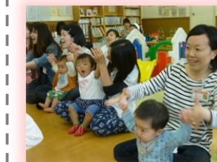
ママと音楽に合わせて 体を重かすの楽しいね♪