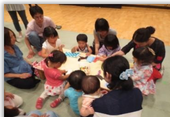
おりひめ、ひこぼしの七夕飾り製作中!