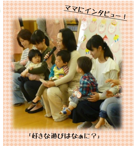
「好きな遊びはなに?」