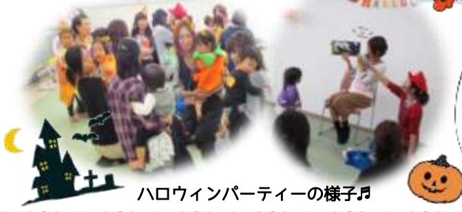
ハロウィンパーティーの様子♪