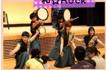
拍手喝采!! いろんな楽器の音を体で感じたよ♪