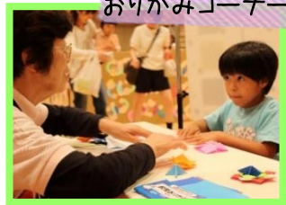
ボランティアさんにいろんな折り方を教えてもらったよ!