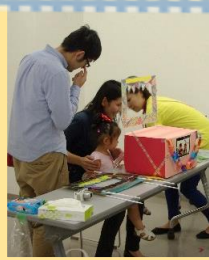
可愛いフレームで記念写真!