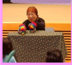
手袋ファンタジー♪ みんな大喜び!!