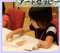
パステルを使って自由に表現遊び♪