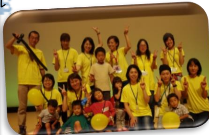
チャイルドフェスタ 実行委員会のみなさん