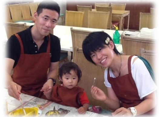
パパ 真実ちゃん(2才) ママ 海上保安官 海上保安官

0・1・2歳児のお子さんを持つお父さん、『くれくれ♣ば』を利用してみてはいかがでしょうか？！