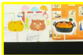
ペープサート 「カレーライスのうた」

話しかけたりする機会が増えたそうです。ひろばの中はもちろん、地域でも子育て中の親子とのつながりを大切にしてくれている『あおむし隊』のみなさんです☆