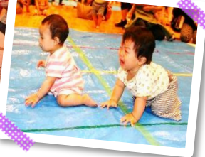
☆昨年のチャイルドフェスタの様子☆