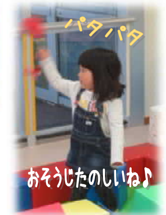
おそうじたのしいね♪

重曹は口にしても安全ということで、『ひろひろ♣ば』でも使っています。あっという間に終わったNCでしたが、みんなの表情はとてもすがすがしく見えました。ご協力いただいたみなさん、ありがとうございました!! NCは今後も開催していく予定ですので、ぜひ参加してみてくださいね。詳しくは「いろは」のブログをご覧ください