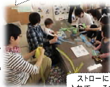
ストローにヒモを入れて...それから?

4月24日(水)「いろは」主催の『ナチュラルクリーニング(NC)』を行いました。NCは「みんなの『ひろひろ♣ば』を、みんなできれいにしよう」と利用者さんたちのアイデアで始まった、月1回(不定期)10分程度のおそうじタイムです。今回はそうじだけでなく、ビニールひもとストローを使った“ハタキづくり”にもチャレンジしました。利用者さんたちに協力してもらいながら、一週間くらい前から少しずつハタキづくりを進めて、当日は参加者のみなさんに最後の仕上げをしてもらいました。お母さん同士が作り方を教えあったり、子どもたちはビニールひもを裂いてハタキの先の部分を作ったり...。わいわいと楽しみながらMyハタキを完成させていました。そうじの時間では、子どもたちが色とりどりのハタキを持ってパタパタと手を動かす様子がとても可愛らしく、心がほっこり和みました。大人たちは重曹水でしぼったぞうきんを使っての拭きそうじです。