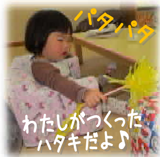
わたしが作ったハタキだよ♪

重曹は口にしても安全ということで、『ひろひろ♣ば』でも使っています。あっという間に終わったNCでしたが、みんなの表情はとてもすがすがしく見えました。ご協力いただいたみなさん、ありがとうございました!! NCは今後も開催していく予定ですので、ぜひ参加してみてくださいね。詳しくは「いろは」のブログをご覧ください