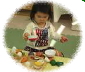
絵本もままごとも大好きです

娘は先天性内反足です。(つま先が90度以上内側を向いている)その矯正の都合で、『ひろひろ♣ば』では室内で装具を付け、ウッドデッキでは裸足で遊ばせてもらっています。スタッフの方や、遊びにいらしているみなさんの温かい対応のおかげで、娘は『ひろひろ♣ば』で遊ぶことが大好きです！毎日遊びに行くのを楽しみにしています。これからも、よろしくお願ひします。足のこともあまり気にしていないので、気軽に声をかけてくださいね！